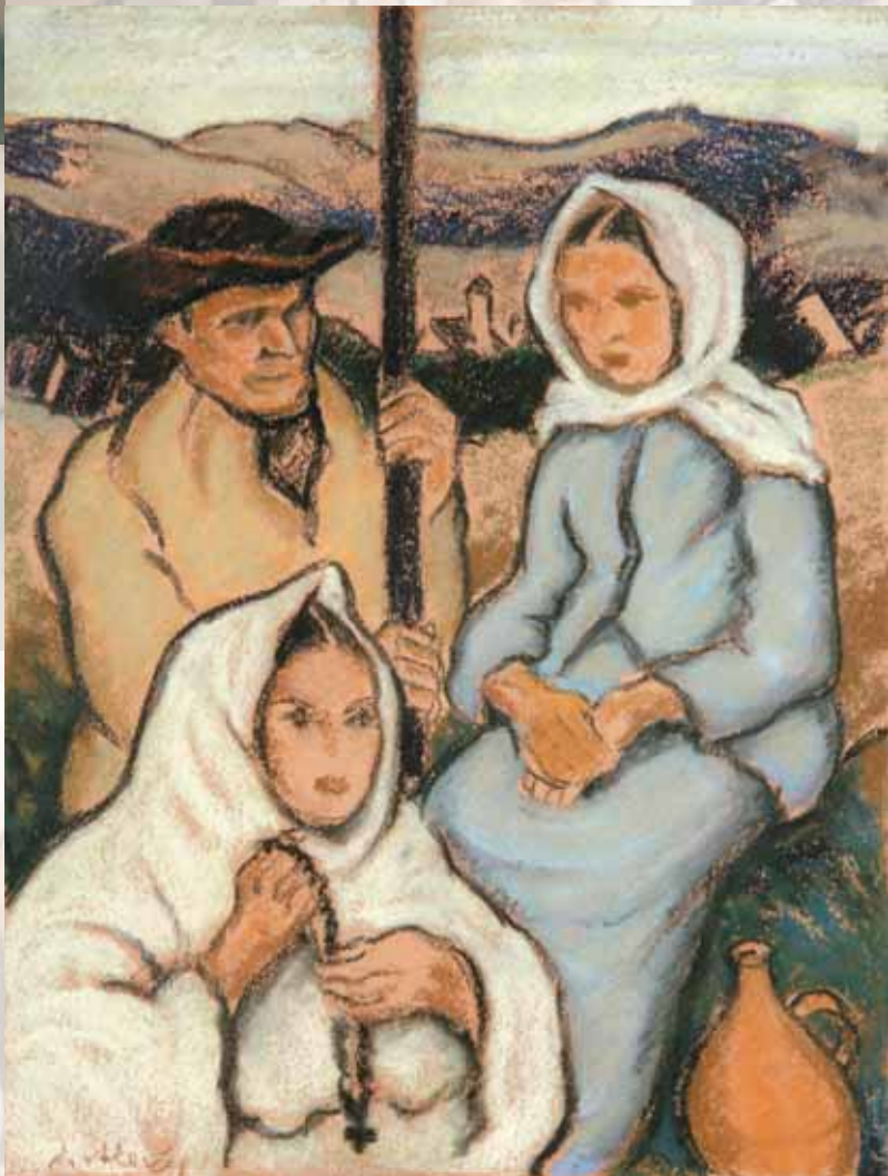
Na poli | On the Field | 1929-33 | pastel | Pastel | SG Banská Bystrica