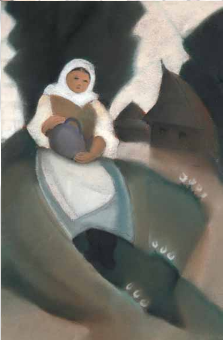
Dedinčanka | Village Woman | 1931 | pastel | Pastel | GPMB Liptovský Mikuláš »