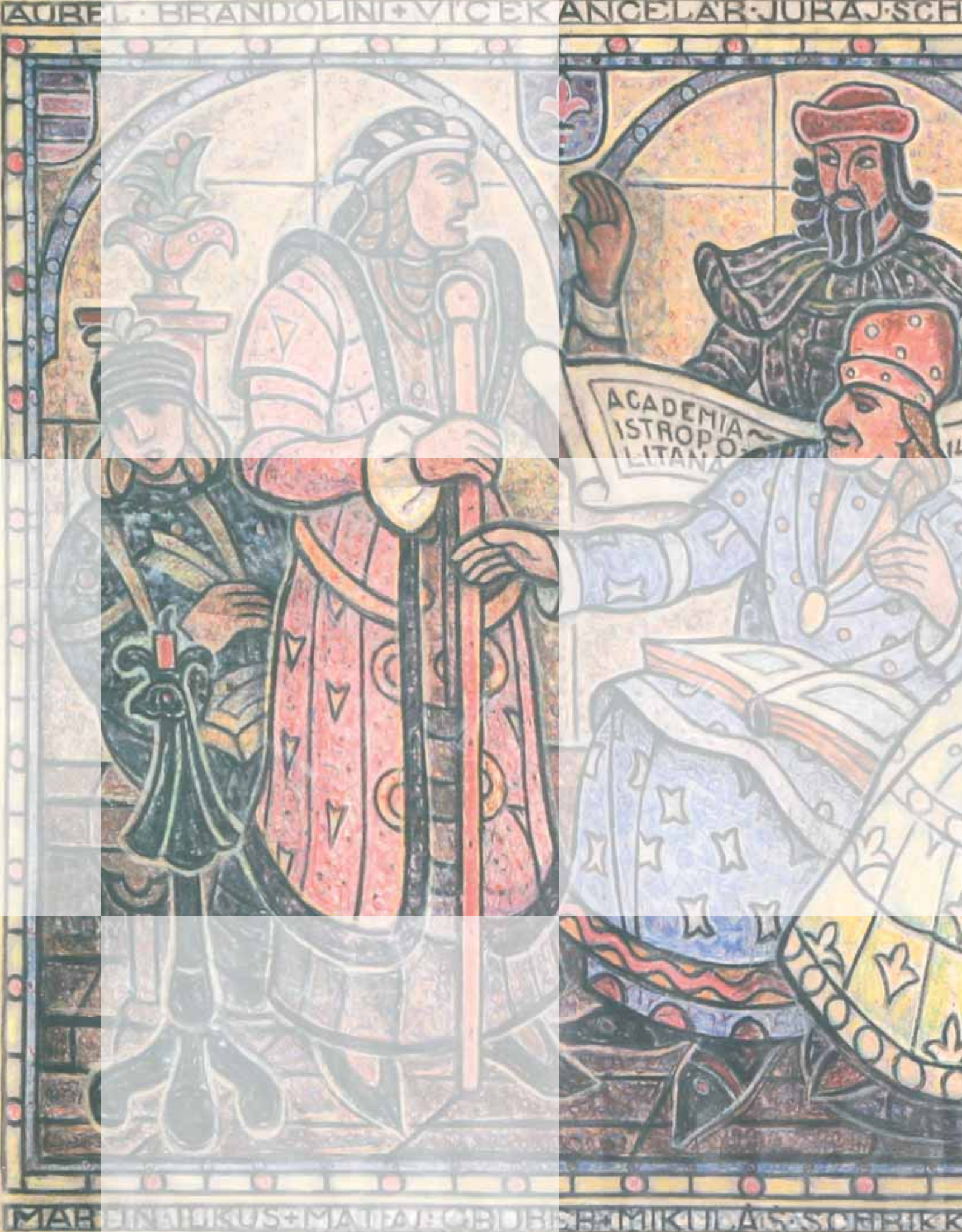
Na obale: Matej Korvin | Matej Korvin | pastel | Pastel | súkromnýmajiteľ | Private collection