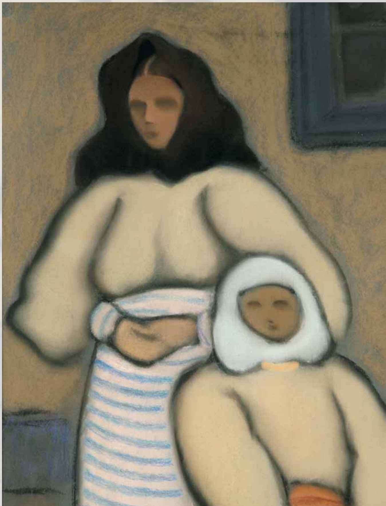
Dve ženy v kroji | Two Women in Folk Costumes | 1932 | pastel | Pastel | SG Banská Bystrica