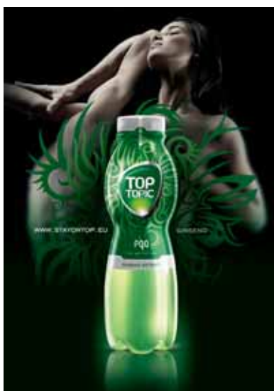
■ TOP TOPIC, ST. NICOLAUS - Trade, TESCO akciový leták, produktový leták, imidžový leták