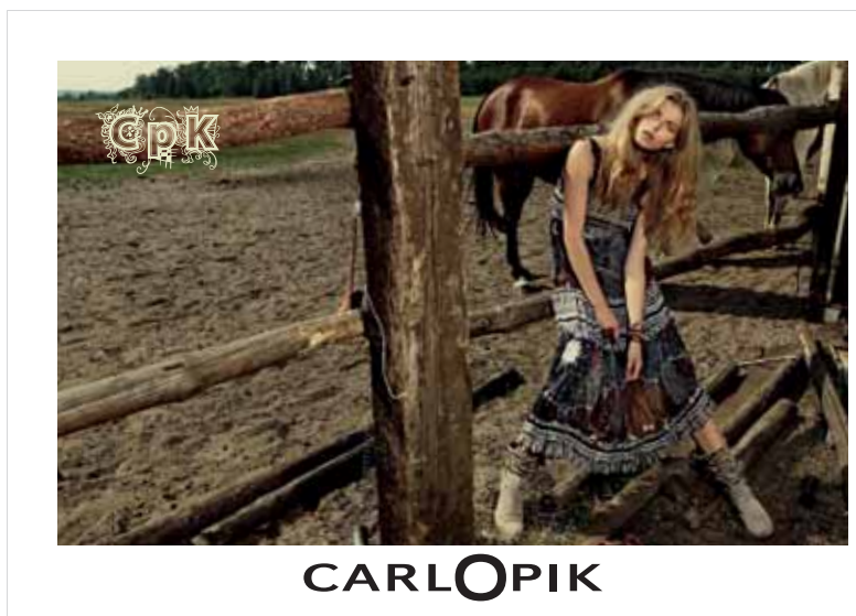
■ ST. NICOLAUS - Trade plagáty