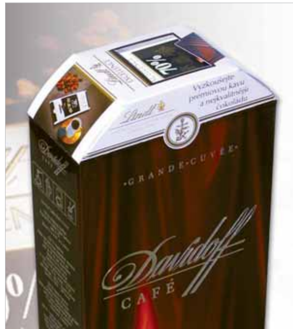
■ LINDT copacking